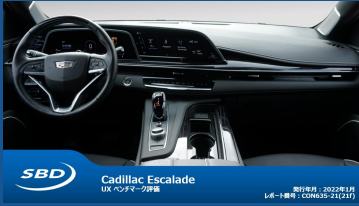
SBD Cadillac Escalade UX ベンチマーク評価 発行年月：2022年11月 1/6-1/8ページ（2022年11月21日）